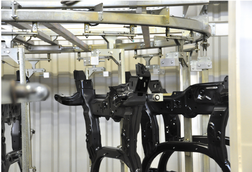
Achsträger nach der Naht-Beschichtung - diese ist nur an einer matten Oberfläche zu erkennen

Sicherheits-Zellen wird mit einer unabhängigen Sicherheits-SPS abgebildet. Damit wird eine größtmögliche Anlagenflexibilität und Verfügbarkeit gewährleistet. Die Kabinen sind einzeln zu- oder wegschaltbar, dennoch geht immer die Sicherheit vor.