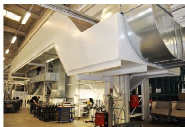
A-Trockner mit anschließender Kühlzone

Der direkt befeuerte Zwei-Zonen-Düsentrockner wurde in wärmeverlustrarmer A-Konfiguration ausgeführt und Platz sparend hoch über den Fertigungsanlagen angeordnet.