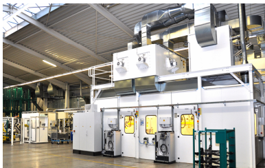
Anlagenfront mit Qualitätskontrollbereich (hinten)

Die Filterflächen sind sehr großzügig ausgelegt. Diese Maßnahme ist Standzeit verlängernd und vor allem Strom sparend, weil die Pressungen in zweiter Potenz zur Filterfläche sinken.